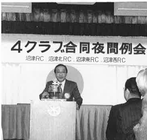
第183回例会 3.15 4クラブ合同例会(ホスト)