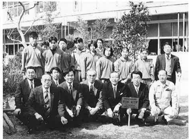
第181回例会 3.2 原中中庭にて記念植樹 (金木犀・百日紅)