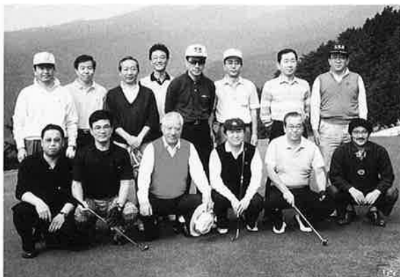
10.18 第1回ゴルフコンペ