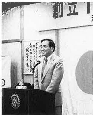
第64回例会 9.12 創立1周年記念例会 市長講演