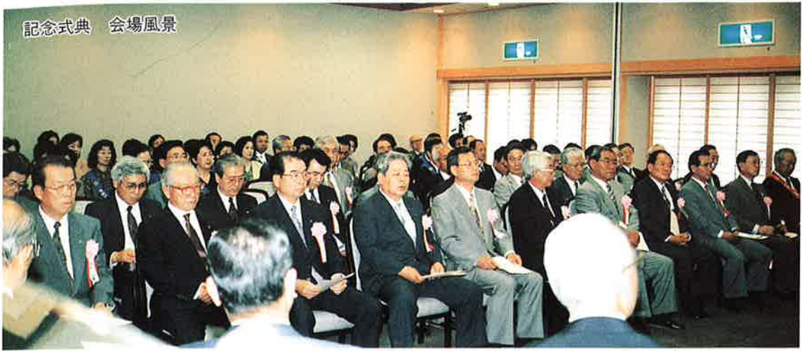
記念式典 会場風景