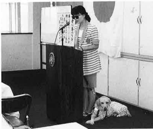
第206回例会 8.31 公開例会 外部卓話『盲導犬と私』