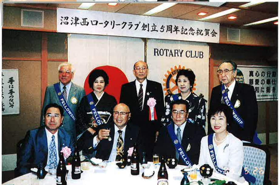
▶ ガバナーを囲んで