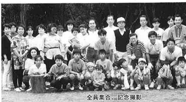
全員集合、記念撮影