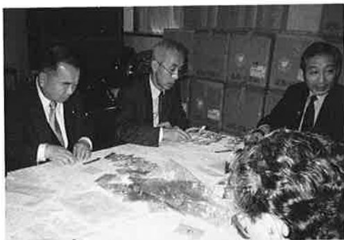
第25回例会 11.28 認証状伝達式準備例会