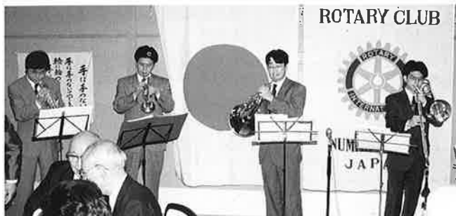
アトラクション 吹奏楽団