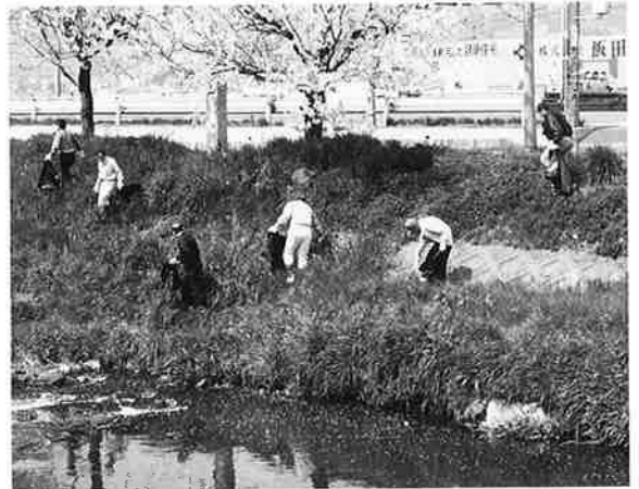
第235回例会 4.11 沼川清掃奉仕作業