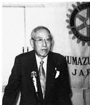
第75回例会 11.26 特別代表卓話