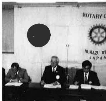
第76回例会 12.3 クラブ協議会