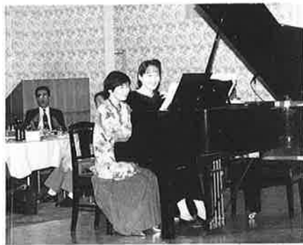
第121回例会 11.18 音楽鑑賞会