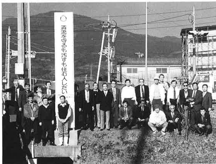
第124回例会 12.9 河川愛護塔除幕式 & 河川清掃