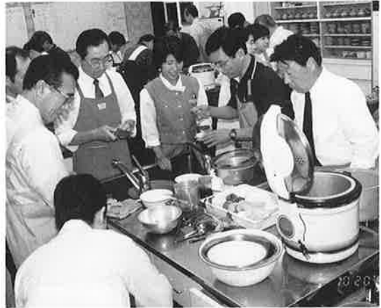
第165回例会 10.20 男の料理教室