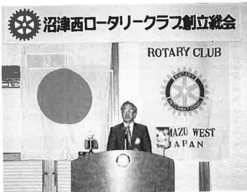
第1回例会 1991.5.30 創立総会