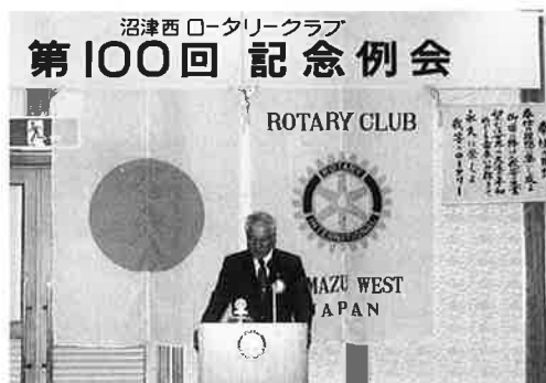
第100回例会 6.10 第100回記念例会