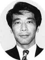
牛 木 等