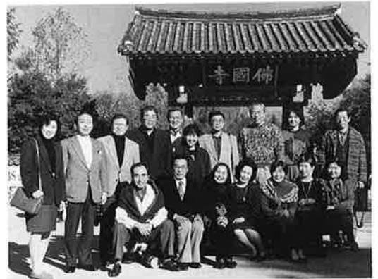
11.3 韓国RC訪問 慶州市仏国寺前で記念撮影