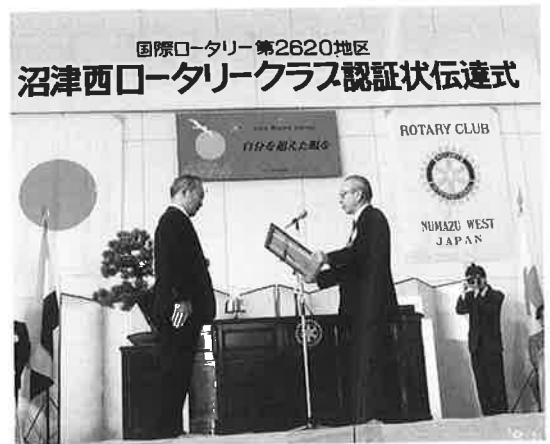
11月30日 認証状伝達式