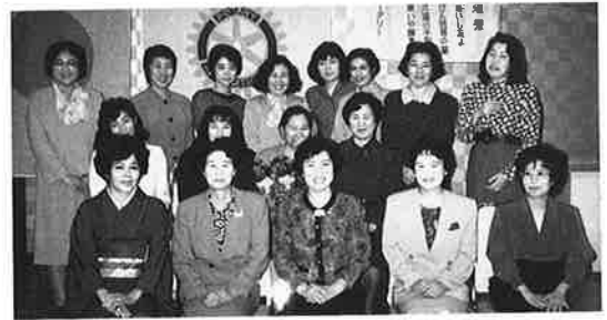
第22回例会 11.7 初めての婦人同伴例会