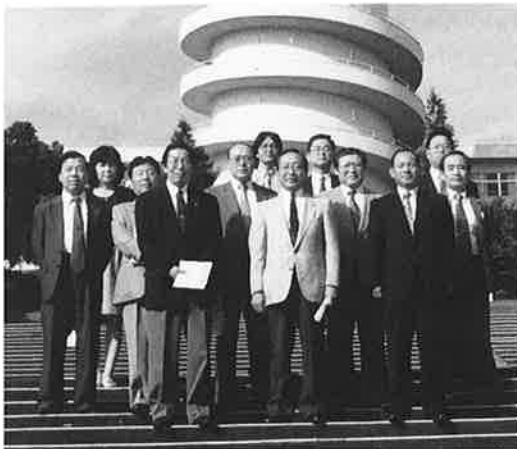
第163回例会 10.6 東海大学開発工学部見学会