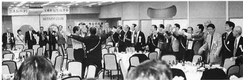
締めくくり「手に手つないで」