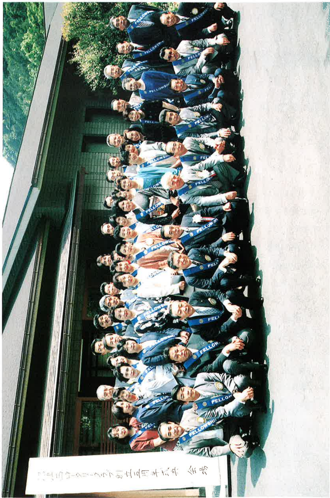
1996. 5. 26 長泉山莊玄閣