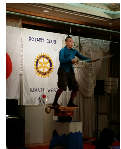
大道芸人あまる様による大道芸