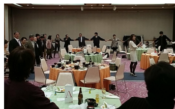
参加者全員での 手に手をつないで