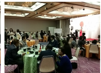
食事と演奏を聴きながらの会員と ゲストとの歓談中の様子