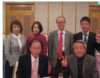
認定NPO法人マム川端理事長、多々良副理事長を招待(寄付目録を贈呈)