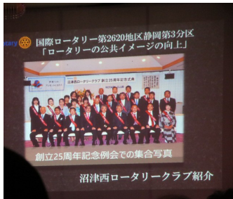
静岡第3分区 9クラブ活動報告 沼津西RC 活動内容紹介 (製作者: 重光純君)