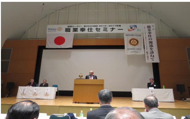
職業奉仕セミナーの開会式の様子