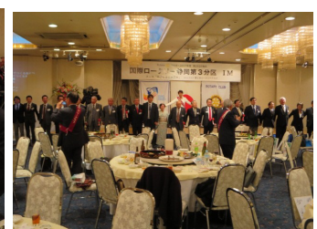
懇親会風景 最後は『手に手つないで』