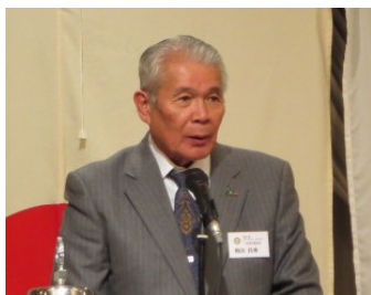
指出昌秀IM実行委員長 記念事業趣旨説明