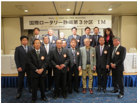
クリスタルホールパテオン式典会場にて集合写真