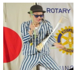
アトラクション (バレエ、大道芸)