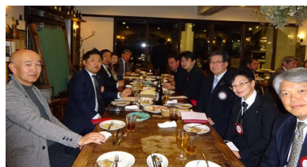
懇親会に出席された皆さん