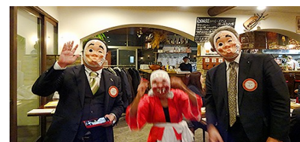
日向ひょっとこ踊りのご披露