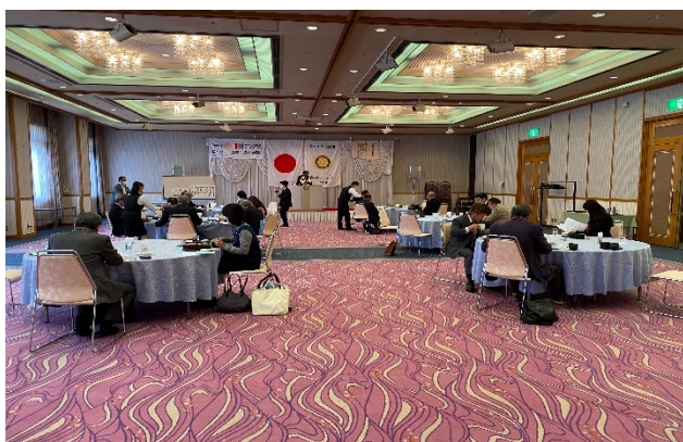
(写真上) ニューウェルサンピア沼津例会場内、(右) 各発表者

山本宜司次年度会長及び次年度理事の承認により、次年度幹事が渡邊勝也 君から宮島賢次 君に変更となりました。(2/4 確認)それに伴い、今年度の副幹事も宮島賢次 君に変更となります。→承認