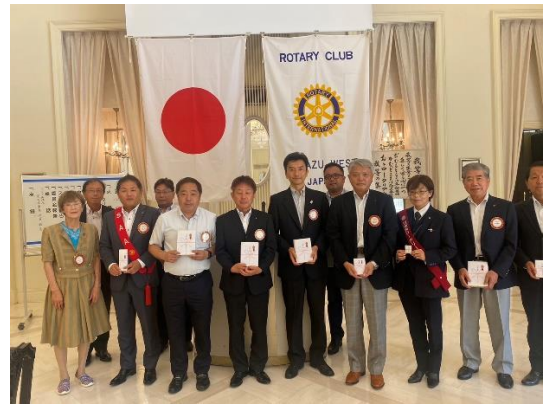
クラブ表彰の皆様