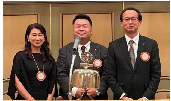
前回以降の新入会員挨拶

最後に、ここにお集まりの皆様のご健康とご多幸を祈念いたしまして、閉会の挨拶とさせていただきます。