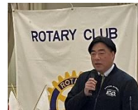
頼重秀一沼津市長

日頃より本市行政に対してまして多大なるご理解、ご協力をいただき、誠にありがとうございます。