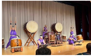
オープニング演奏 富岳太鼓