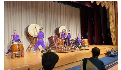
迫力のある演奏から