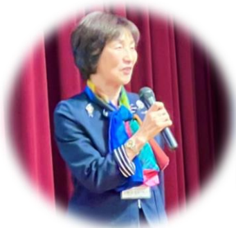
『これまでのロータリー、これからのロータリー』